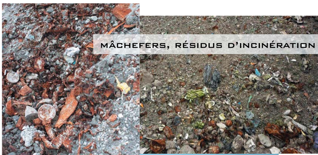
MÂCHEFERS, RÉSIDUS D'INCINÉRATION

HTTPS://WWW.ADMIN.CH/OPC/FR/CLASSIFIED-COMPILATION/20141858/INDEX.HTML#A36